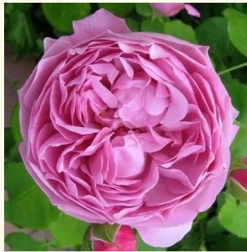
Charles Rennie Mackintosh

roze - nostalgische roos 75-110 cm zeer sterk, op afstand waarneembaar geurige roos - klassiek, rozenachtig-fruitig Dominique Massad