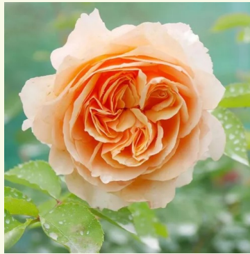
Froufrou tante Jackie

cr me-wit - nostalgische roos 120-170 cm middelsterke, goed waarneembare geurige roos - met een aangenaam zoet karakter Alain Meiland