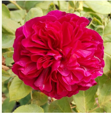
Bicentenaire de Guillot

geel - nostalgische roos 90-130 cm sterk, goed waarneembaar geurende roos - zoetig, citrusachtig Fabien Ducher