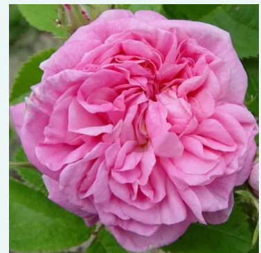
La Ville de Bruxelles

roze - historische, alba-roos 120-180 cm zeer sterk, de tuin vullende geur roos - vol, klassiek rozenaroma James Booth