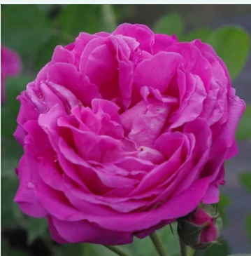
Duchesse de Rohan

roze - historische, china-roos 120-180 cm sterk, goed waarneembaar geurende roos - zoetig, klassiek rozenkarakter Jean Laffay