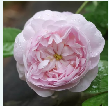
Duchesse De Montebello

paars - historische, damastroos 200-300 cm zeer sterk, tuinvullend geurende roos - rijk, damastroosachtig Jean Laffay