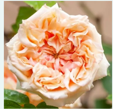
Gloire de Dijon

karmozijnrood - historische, bourbonroos 130-180 cm sterk, langhoudend geurende roos - vol, bourbonachtig Rudolf Geschwind