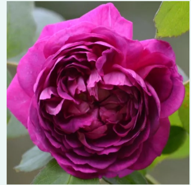
Reine des Violettes

roze - historische, bourbonroos 150-260 cm sterk geurende, volle roos - vol, klassiek rozenkarakter Mauget