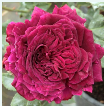
Empereur du Maroc

roze - historische, portlandroos 90-140 cm sterk, langdurig geurende roos - vol, klassiek oude roos aroma René Lévêque