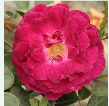
Trompetter von Säckingen

karmozijnrood - historische, herbloeiende hybride roos 160-250 cm sterk, langhoudend geurende roos - rijk, damastroosachtig François Lacharme