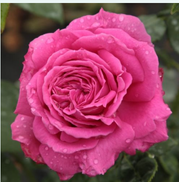
Madame Isaac Pereire