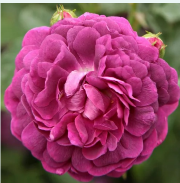
Cardinal de Richelieu

karmijnrood - historisch, mosroos 120-190 cm uiterst sterk, de tuin vullende geurende roos - diep kruidig Jean Laffay