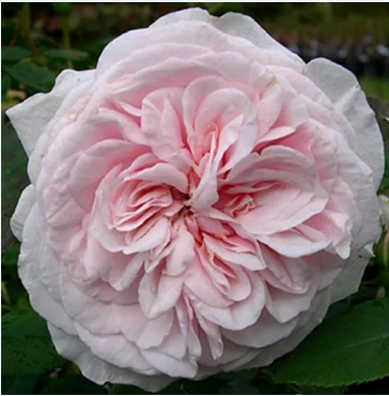
Souvenir de la Malmaison

licht-roze - historische, bourbonroos 110-160 cm sterk, langdurig geurende roos - zoetig, theerig, klassiek theerooskarakter Jean Béluze