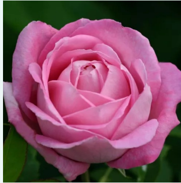
Mrs. John Laing