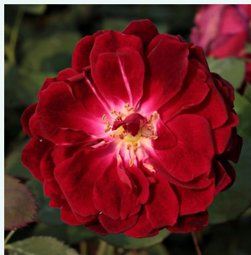
Gruss an Teplitz

geel - historische, oude tuinroos 320-500 cm sterk, goed waarneembare geurende roos - fris, fruitig karakter George Paul, Jr.