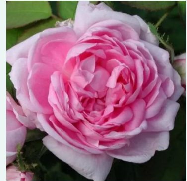
Marie de Blois

licht-roze - historische, alba-roos 120-190 cm uiterst sterke, van ver waarneembare geur roos - klassiek, rozenachtig -