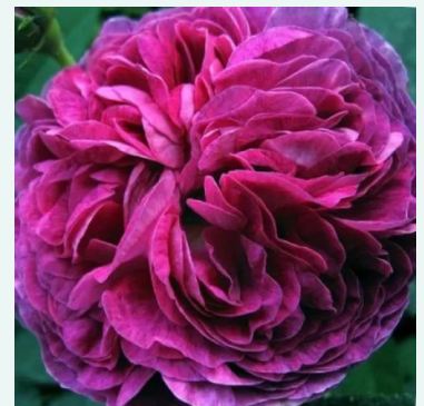
Belle de Crécy

rood - historische, remontant-hybride roos 100-150 cm zeer sterk, de tuin vullende geurige roos - rijk, oud- rozenkarakter Reverchon