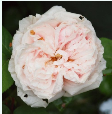
Ännchen von Tharau

roze - historische, gallica-roos 150-210 cm sterk geurende, goed waarneembare roos - kruidig, rozenachtig Jean -Pierre Vibert