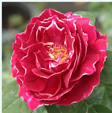
Baron Girod de l'Ain

roze - historische, oude tuinroos 280-420 cm sterk, langdurig geurende roos - klassiek oud- roosachtig Rudolf Geschwind