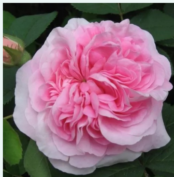
Königin von Dänemark

roze - historische, damaskroos 140-200 cm zeer sterk geurende, van veraf waarneembare roos - parfumachtig, rozenachtig