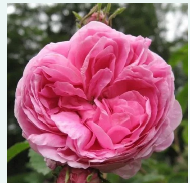
Rose des Peintres

paars - historische, portlandroos 85-135 cm zeer sterk, van veraf waarneembaar geurende roos - klassiek, rozenachtig karakter -