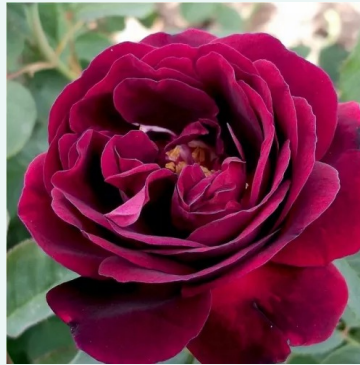
Souvenir du Docteur Jamain

licht-roze - historische, bourbonroos 110-160 cm sterk, langdurig geurende roos - zoetig, theerig, klassiek theerooskarakter Jean Béluze