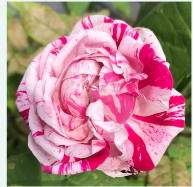
Variegata di Bologna

middenroze - historische, centifoliar Roos 120-190 cm zeer sterk, van ver waarneembare geurige roos - zoetig, citrusachtig -