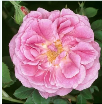
Queen of Bourbons

middenroze - historische, damastroos 100-170 cm zeer sterke, tuinvullende geurige roos - vol, damastroosachtig Alain Meilland