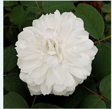
White Jacques Cartier

paars - historische, gallica-roos 120-190 cm matig sterke, goed waarneembare geurige roos - fluweelzacht, licht bessenachtig-fruitig -