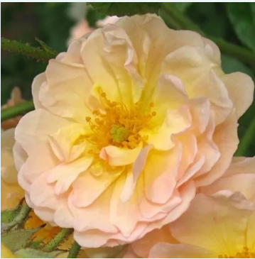
Ghislaine de Féligonde

paars-roze - historische, oude tuinroos 350-550 cm zeer zwakke, nauwelijks waarneembare geurige roos - geurbeschrijving niet beschikbaar Rudolf Geschwind