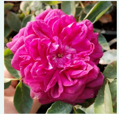
Arthur de Sansal®

wit - historische, alba-roos 280-420 cm middelsterk, goed waarneembaar geurende roos - kruidig, fruitig Rudolf Geschwind