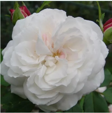
Boule de Neige

crème-wit - historisch, damastroos 105-155 cm sterk, langdurig geurende roos - damaskusroosachtig, parfumachtig François André Robert