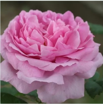
Comte de Chambord

roze - historische, portlandroos 80-130 cm zeer sterke, van ver te ruiken geurige roos - klassiek damaskuskarakter André Robert; François Moreau