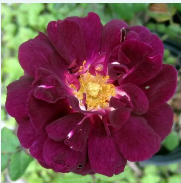
Nuits de Young

roze - historische, alba roos 140-200 cm zeer sterk geurende, lang aanhoudende roos - geuomschrijving niet beschikbaar James Booth