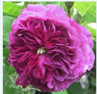
Erinnerung an Brod

karmozijnrood - historische, herhalend bloeiende hybride roos 110-160 cm zeer sterk geurende, tuinvullende roos - diep kruidig- zoet Bertrand Guinoisseau -Flon