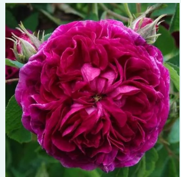
Charles de Mills

roze - historische, damastroos 135-225 cm zeer sterk, van ver te ruiken geurige roos - zoet-kruidig, damastroosachtig