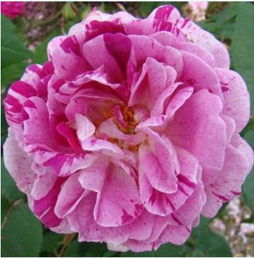
Honorine de Brabant

roze - historische roos, bourbonroos 150-220 cm sterk, markant geurende roos - zoet, fruitig-roosachtig karakter Hyacinthe Rémi Tanne