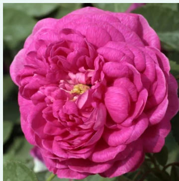
Rose de Resht

groen - historisch, chinese roos 80-130 cm zeer zwak, nauwelijks waarneembare geurende roos - kruidig karakter John Smith